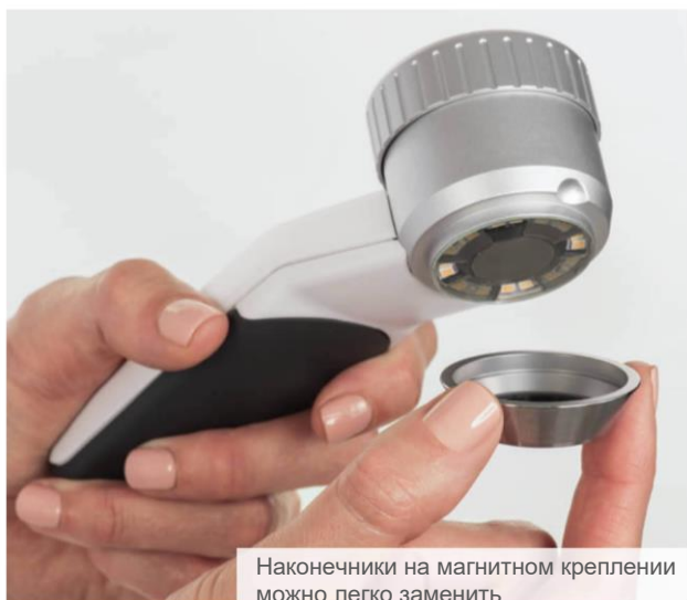
Наконечники на магнитном креплении можно легко заменить